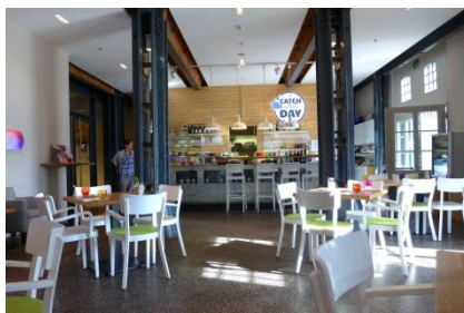
Abb. 9: WC