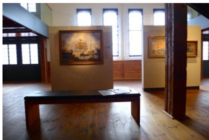
Abb. 6: Ausstellung