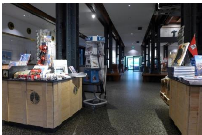
Abb. 5: Foyer