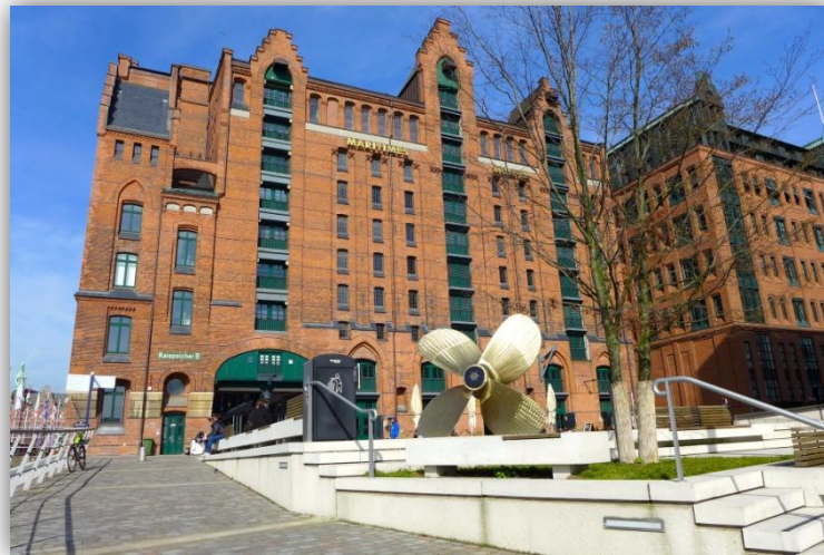
Abbildung 1: Außenansicht des Internationalen Maritimen Museums