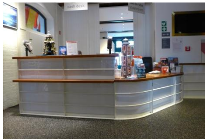
Abb. 6: Kasse