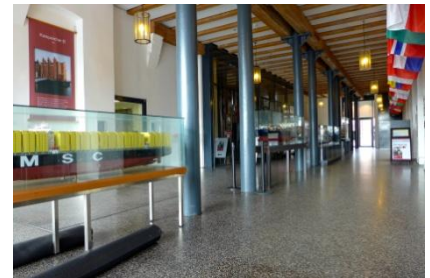
Abb. 4: Zuwegung innen