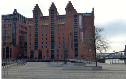
Abb. 2: Außenansicht